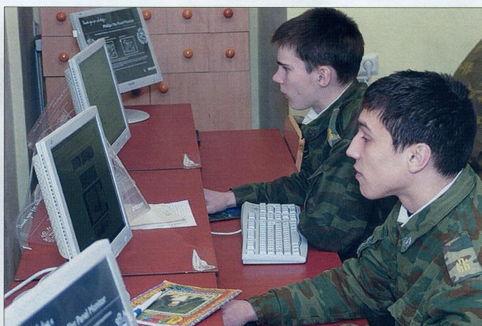
Кадетские будни и праздники.