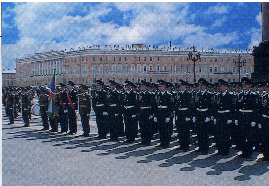
Кадеты на Дворцовой площади в Санкт-Петербурге.

Пограничный корпус — военно-учебное заведение с гуманитарной направленностью: кадеты изучают основы юриспруденции, военную историю, английский язык в объёме специализированного лица, проходят общевоинскую подготовку. Имеется и физико-математический класс. По задумке руководства ведомства в стенах корпуса можно и нужно создавать основы для сознательного выбора и последующего освоения профессиональных программ в